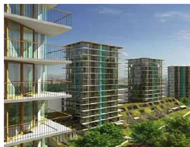
Central Park Praha, CPP Development

Průměrná úroková sazba v srpnu činila 5,82%, což je nejvíce od počátku roku 2003. Počátkem září pak světové finanční trhy zasáhla další vlna americké hypoteční krize a laická i odborná veřejnost nyní hledá odpověď na otázku – co bude dál? Jak se bude dál vyvíjet český hypoteční trh?